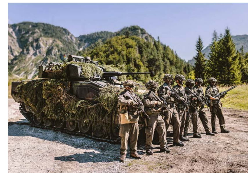
Österreich hat sich zur eigenständigen Verteidigung des Landes und der Neutralität verpflichtet, doch das Bundesheer leidet seit Jahrzehnten unter Unterdotierung

Aber große Diskussionen über die Neutralität? Fehlanzeige. Selbst als Finnland und Schweden aus ihrer Neutralität unter den Nato-Schirm flüchteten, kamen hierzulande von allen Parteien Bekenntnisse zur Neutralität. In einem kürzlich aufgeflamten Disput über eine Hilfe bei der Entminung in der Ukraine wandte sich Verteidigungsministerin Klaudia Tanner (ÖVP) strikt gegen eine Teilnahme Österreichs, Bundespräsident Van der Bellen votierte öffentlich stark dafür und meinte, humanitärer Dienst sei mit der Neutralität jederzeit vereinbar. Tanner hingegen argumentierte, man könne bei einer Entminung von Landesteilen schwerlich unterscheiden zwischen einer Hilfe für die Zivilbevölkerung und einer Unterstützung des Militärs. Der politische Diskurs endete – man kann es so sagen – typisch österreichisch: Die Regierung entschied sich für finanzielle Unterstützung der