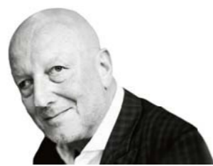
ROGER DE WECK

Nein. Es geht ja nicht darum, sich komplett aus China zurückzuziehen. Aber kein Unternehmen darf regelrecht von China abhängig werden. Das ist das Wichtigste. Die große Illusion der frühen