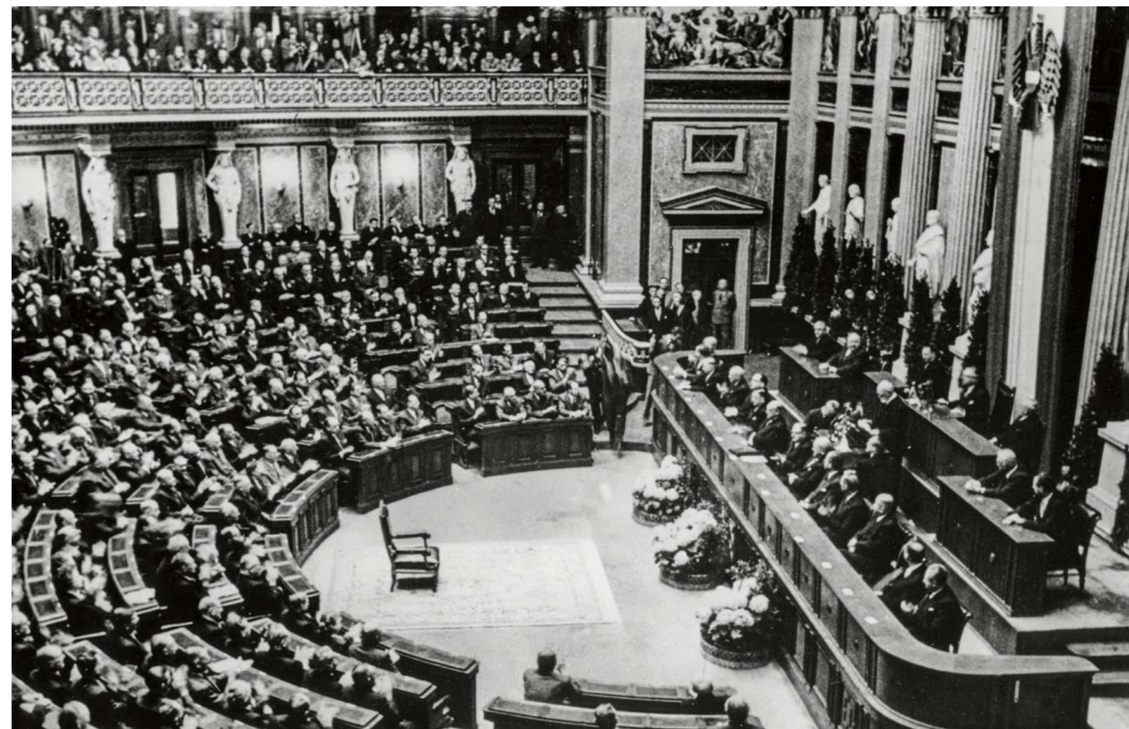
Blick in den Sitzungssaal der Bundesversammlung in Wien. Am 26. Oktober 1955 wurde das Bundesverfassungsgesetz über die „immerwährende Neutralität“ Österreichs verabschiedet